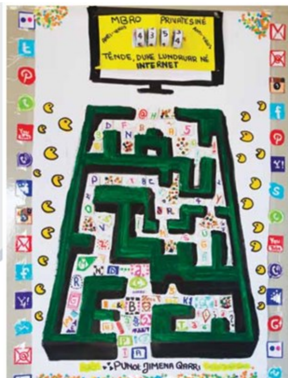
Jimena Qarri Shkolla “Sevasti Qiriazi” Korçë