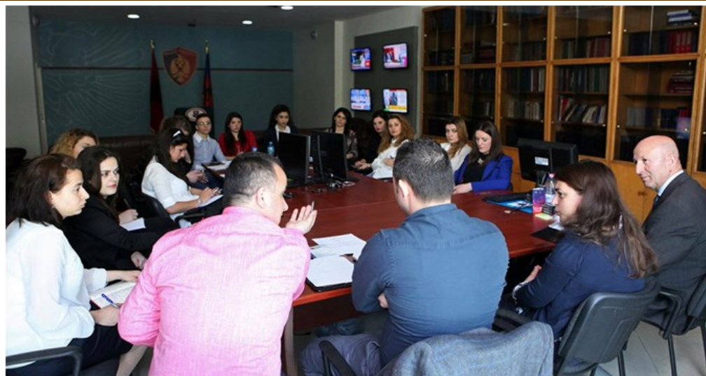
Takim trajnues me zëdhënësit e Policisë së Shtetit për mbrojtjen e të dhënave personale dhe të drejtën për informim.