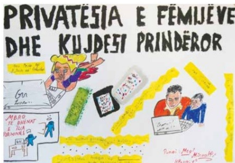
Megi Minxolli Shkolla "17 shkurti" Qesarakë, Tiranë

Interneti nuk është i gabuar, por edhe të këqija ka, është një botë shumë e trazuar, se kuptojmë, duhet të rritemi edhe ca.