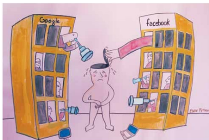
Eden Fetahu Shkolla “Jeronim de Rada” Tiranë