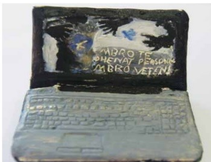
Olvi Xhaferraj Shkolla “Jeronim de Rada” Tiranë