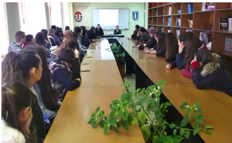
Universitetit i Tiranës — Filiali Sarandë

Në këto takime, u trajtuan edhe raste praktike të shkeljes së privatësisë dhe keqpërdorimit të të dhënave personale, si dhe u diskutua për shfrytëzimin e avantazheve që të ofron interneti, rrjetet e ndryshme sociale apo dhe moria e aplikacioneve. Të tilla takime u zhvilluan më herët gjatë vitit në univeristetet e Tiranës, Shkodrës, Elbasanit, Vlorës dhe Gjirokastrës.