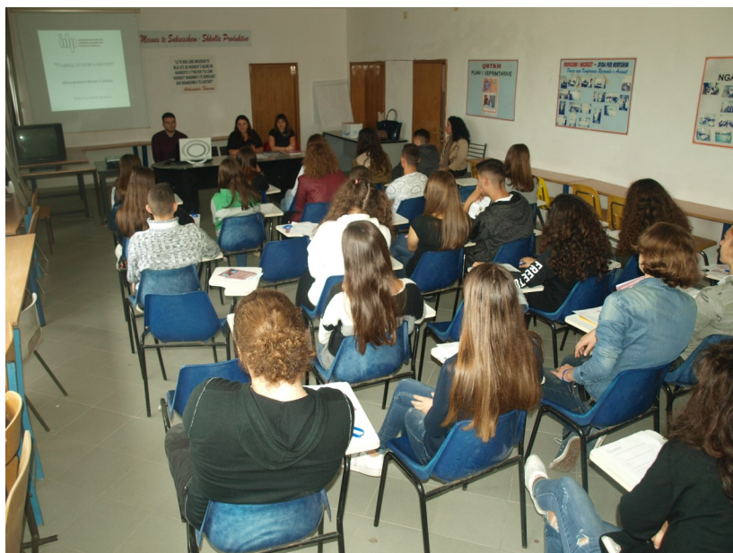
Shkolla e mesme e përgjithshme “Leonik Tomeo”, Durrës

Gjetjet e studimit synojnë të iniciojnë një diskutim gjithëpërfshirës mes institucioneve shtetërore. Adresimi i problematikave të kësaj grupmoshe, të konstatuara edhe në këtë pyetësor, është i rëndësishëm për ta kthyer temën e privatësisë në pikë referimi, kur flasim për përdorimin e sigurt të internetit dhe rrjeteve sociale. Diskutimi mund të jetë, padyshim, në rrafshin legjislativ dhe të hartimit të politikave strategjike, ashtu si edhe në atë të zbatimit të masave konkrete, në radhë të parë në rritjen e nivelit të edukimit dhe ndërgjegjësimit të nxënësve, por padyshim, edhe të mësuesve. Besojmë se avantazhet e aksesit në internet janë të shumta dhe përdorimi i tij dhe pajisjeve të lidhura me të, apo çdo lloj mjedisi dixhital, do të rrisë në mënyrë të drejtë përfitimet, duke mos anashkaluar problematikat. Një nga sugjerimet më të vlefshme ishte që iniciativat e kësaj natyre duhen zhvilluar më shpesh, duke bashkëpunuar me sa më shumë aktorë të sistemit arsimor shqiptar. Veçanërisht, edukimi me parimet e privatësisë është i nevojshëm me nxënësit e shkollave 9-vjeçare, ku ka një përceptim për më shumë probleme edhe për shkak të moshës më të vogël.