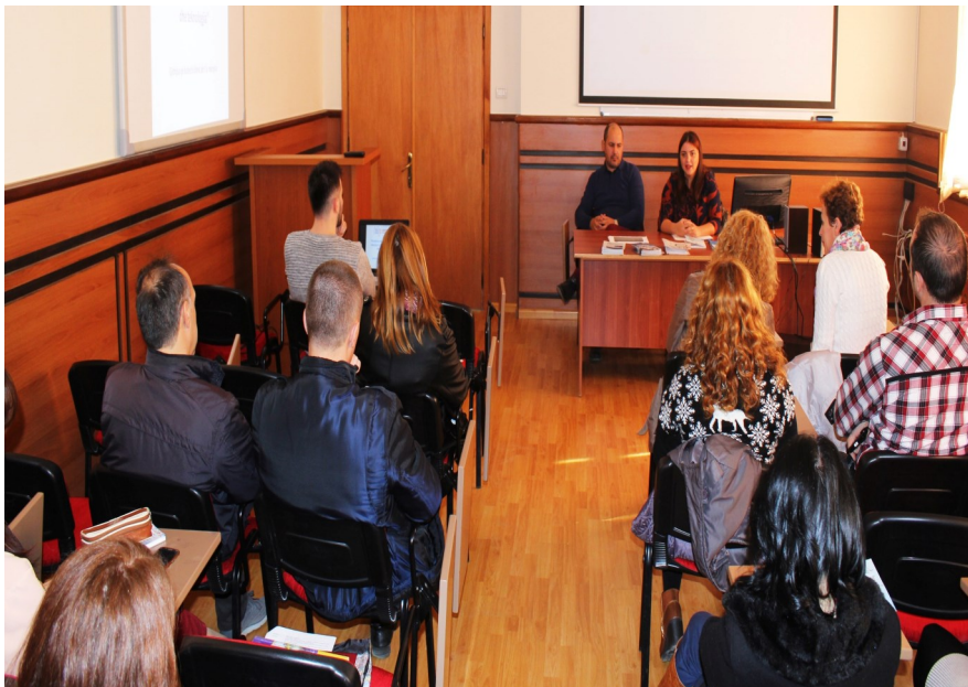
Universiteti "Fan Noli" — Korçë

Zyra e Komisionerit për të Drejtën e Informimit dhe Mbrojtjen e të Dhënave Personale zhvilloi takime me studentë dhe stafin akademik në Universitetin "Fan Noli" të Korçës dhe në Filialin e Sarandës të Universitetit të Tiranës. Këto aktivitete informuese kanë për qëllim rritjen e ndërgjegjësimit për respektimin e të drejtave të qytetarëve dhe në njohjen e legjislacionin që garanton zbatimin e tyre.