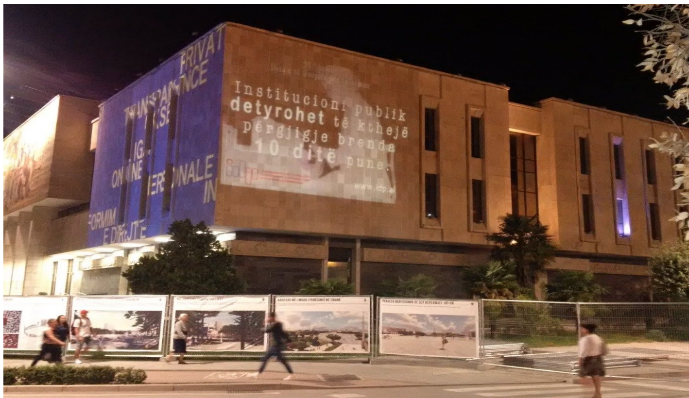
Pamje nga projektimi në fasadën e Muzeut Historik Kombëtar

Kësaj iniciative iu bashkuan dhe operatorët e telefonisë celulare të cilët shpërndanë mesazhin: “Informimi Publik është një e drejtë për ty dhe një detyrim për zyrtarët. Kërko të drejtën tënde! 28 Shtator – Dita ndërkombëtare e të drejtës për informim” .