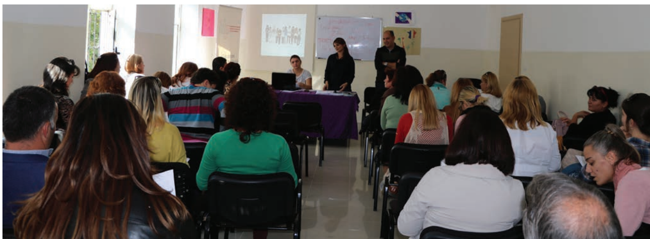
Takimi në Gjirokastrë

Grupi i Punës për Edukimin Digjital i krijuar në vitin 2013, ku dhe Zyra e Komisionerit është anëtare, bashkëdrejtohet nga Autoritetet e Mbrojtjes së të Dhënave Personale të Francës dhe Kanadasë. Ky forum i Konferencës Ndërkombëtare ka për qëllim diskutimin dhe shkëmbimin e praktikave më të mira që promovojnë edukimi digjital në grupmoshat parauniversitare.