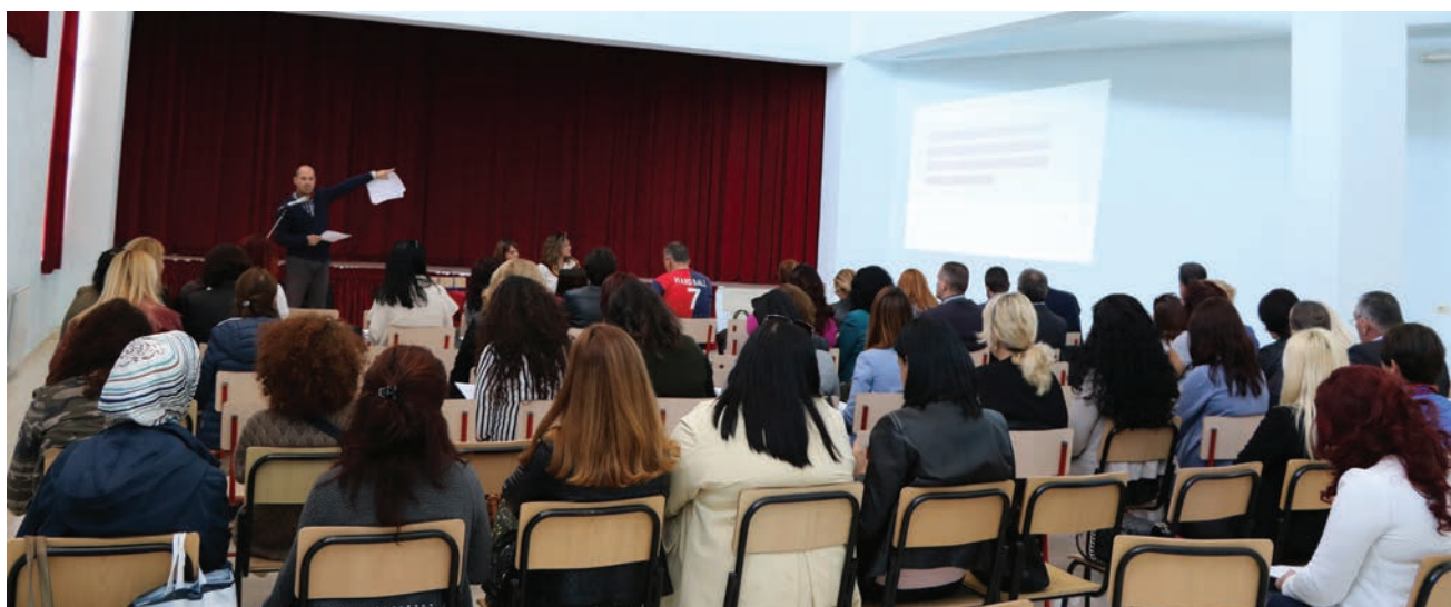
Takimi në Shkodër

“Kuari i aftësisë” është një dokument me 9 parime kryesore për edukim të përgjegjshëm dhe për të rritur sigurinë në mjedisin digjital. Mësuesit marrin njohuritë bazë për mbrojtjen e privatësisë: legjislacionin e fushës; për qëllimin, mënyrat dhe mjetet e përpunimit të të dhënave personale; të drejtat në rastet e keqpërdorimit të tyre; çështjet që kanë të bëjnë me aspekte teknike të sigurisë së të dhënave, etj. Ai është hartuar nga Grupi i Punës për Edukimin Digjital (DEWG), pjesë e të cilit është edhe Zyra e Komisionerit. Ky dokument synohet që të përfshihet në të ardhmen në kurrikulën e arsimit 9-vjeçar.