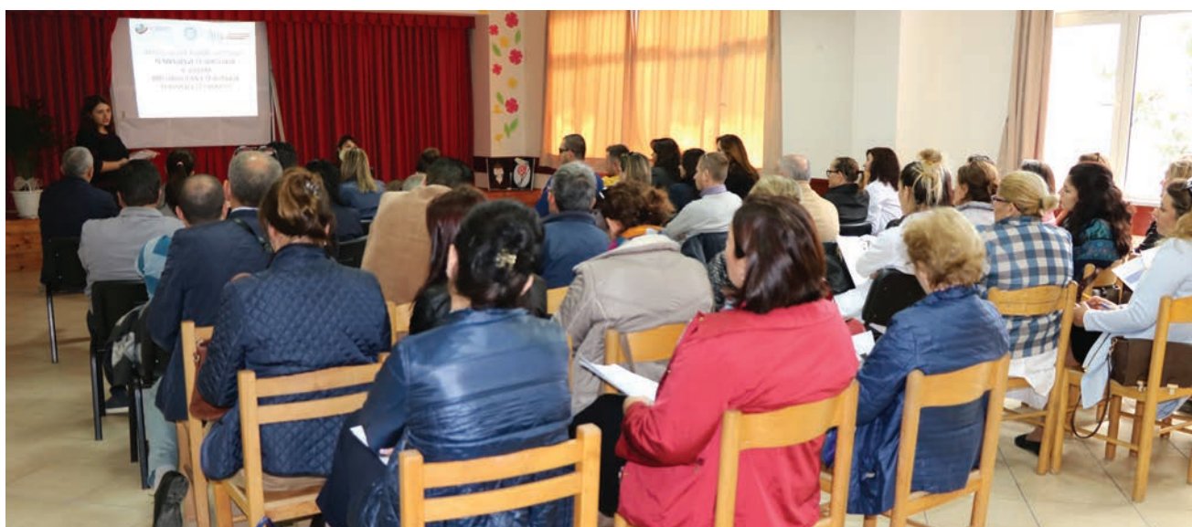
Takimi në Lezhë