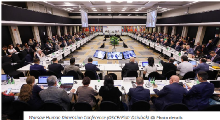
Warsaw Human Dimension Conference Photo details

ORGANIZED BY: The 2023 OSCE Chairpersonship of North Macedonia, with the support of the OSCE Office for Democratic Institutions and Human Rights (ODIHR)